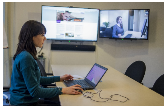
Beobachtungs-/Besucherraum, ca. 20 qm