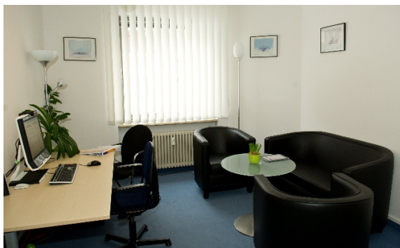
Testraum, ca. 15 qm

(W)LAN in allen Räumen: DSL: 98 MBit/s Download; 25 MBit/s Upload