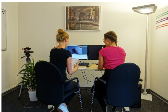
Testraum, ca. 15 qm

(W)LAN in allen Räumen: DSL: 50 MBit/s Download; 10 MBit/s Upload