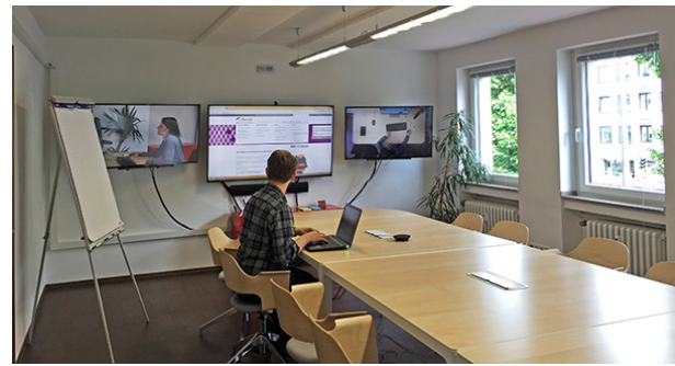
Beobachtungs-/Besucherraum, ca. 30 qm