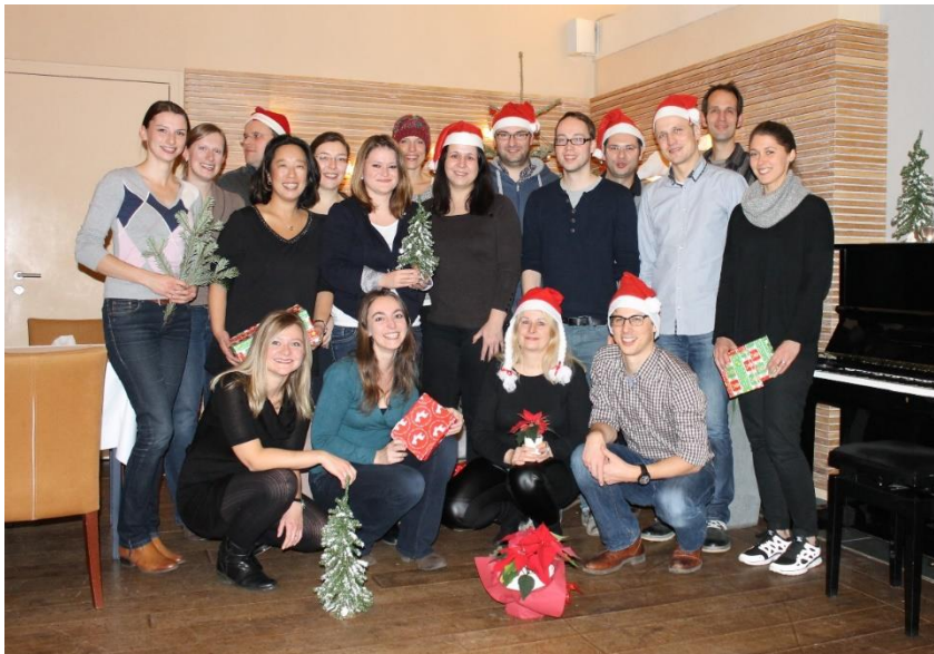
Abbildung 2 – Aktuelles eResult-Team (Weihnachtsfeier/Teamtage 2014 – ohne freie Mitarbeiter)

Aus den anfänglichen 4 Mitarbeitern wurden 35 - Tendenz weiterhin steigend.